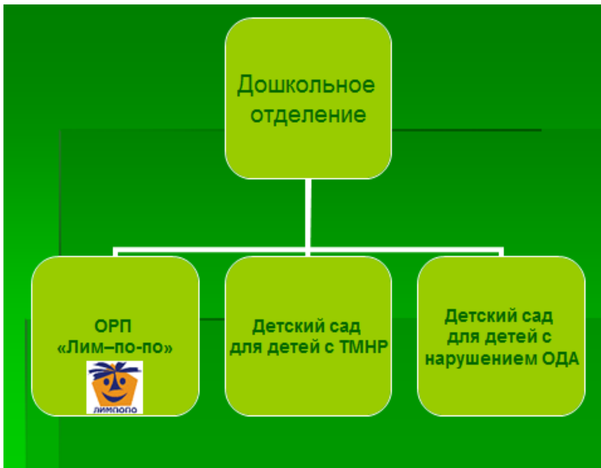
Рисунок 1. Структурные единицы ДО ГБОУ ЦЛП

Структурные единицы представлены на рисунке 1.