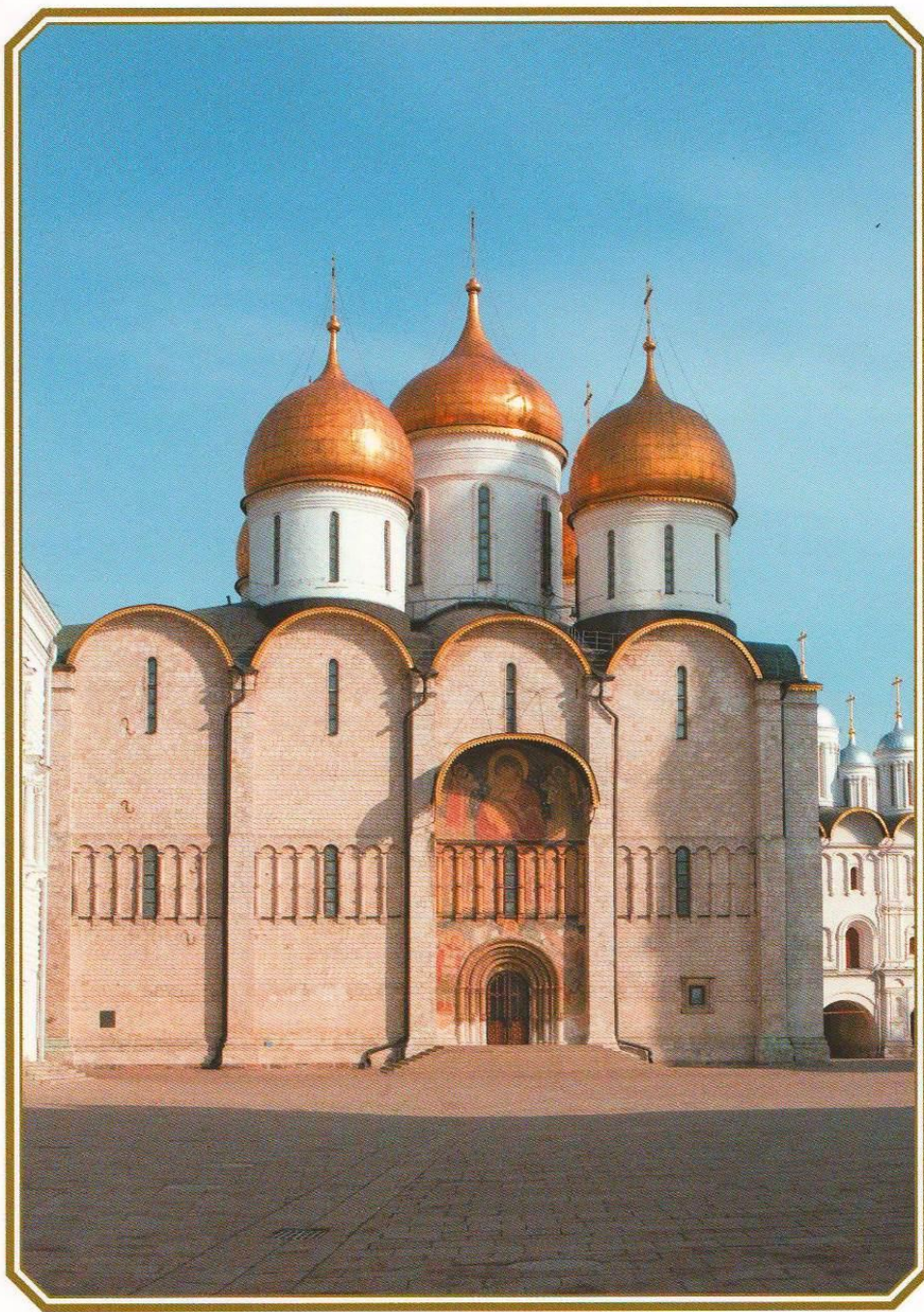
УСПЕНСКИЙ ПАТРИАРШИЙ СОБОР МОСКОВСКОГО КРЕМЛЯ